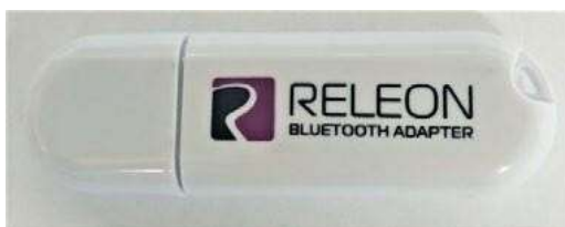
Рис.4. Bluetooth-адаптер Releon

Беспроводной мультидатчик выполнен в виде платформы с многоканальным измерителем, который одновременно получает сигналы с различных встроенных датчиков, размещённых в едином корпусе устройства. Беспроводные мультидатчики подключаются к планшету или компьютеру напрямую. При этом необходима поддержка работы по протоколу Bluetooth low energy (BLE) 4.1, без дополнительных регистраторов данных с помощью входящей в комплект флешки (рис. 4).