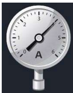
Рис.2 Датчик абсолютного давления