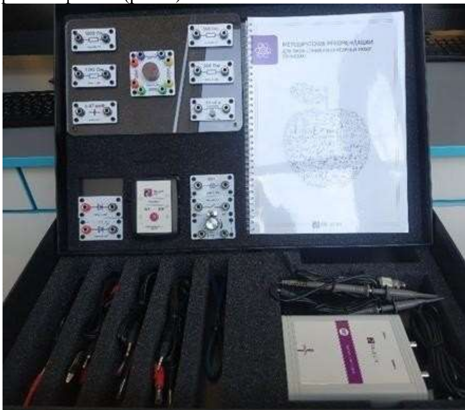
Рис. 1. Цифровая лаборатория по физике

В состав центра «Точка роста» по физике входят базовая (обязательная) часть и дополнительное оборудование. Базовая часть состоит из цифровых датчиков и комплектов сопутствующих элементов для опытов по механике, молекулярной физике, электродинамике и оптике. Дополнительное оборудование (профильный комплект) представляет собой цифровую лабораторию по физике (рис. 1).