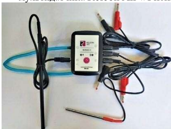
Рис.5. Беспроводной мультидатчик Releon Air «Физика-5»

Рассмотрим технические характеристики, схему и состав беспроводного мультидатчика Releon Air «Физика-5» (рис. 5).